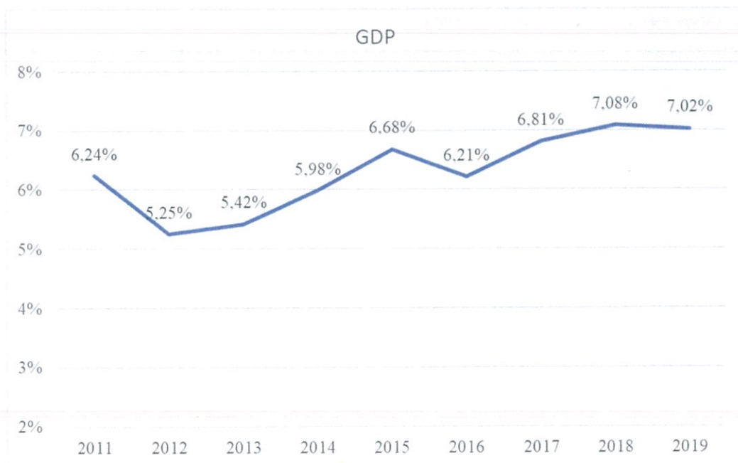
Hình 1: Tốc độ tăng trưởng GDP qua các năm

Tốc độ tăng trưởng kinh tế là một trong những nhân tố quan trọng phản ánh khả năng tăng trưởng của hầu hết các ngành nghề và lĩnh vực kinh tế. Những năm gần đây, nền kinh tế Việt Nam luôn duy trì tốc độ tăng trưởng cao và ổn định so với các nước trên thế giới nói chung và trong khu vực nói riêng.